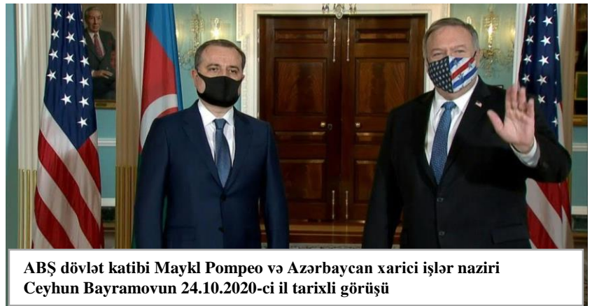
ABŞ dövlət katibi Maykl Pompeo və Azərbaycan xarici işlər naziri Ceyhan Bayramovun 24.10.2020-ci il tarixli görüşü

Oktyabrın 24-də ABŞ dövlət katibi Maykl Pompeo Azərbaycan və Ermənistan xarici işlər nazirləri ilə ayrı-ayrılıqda görüş keçirdi. Bunun ardınca oktyabrın 25-də 3-cü humanitar atəşkəs elan edildi. Ancaq yenə də erməni məkri, erməni xisləti özünü göstərdi. Yeni humanitar atəşkəs rejiminin elan olunmasına baxmayaraq, Ermənistan silahlı qüvvələri bütün cəbhə boyu, eləcə də dövlət