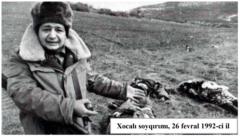
Xocalı soyqırımı, 26 fevral 1992-ci il

1992-ci ilin fevral ayında Xocalı şəhərində azərbaycanlı əhaliyə qarşı misli görünməmiş qırğın törədilmişdir. Xocalı soyqırımı kimi tanınmış bu qanlı faciə minlərlə azərbaycanlının məhv edilməsi yaxud əsir düşməsi ilə nəticələnmiş, şəhər yerlə-yeksan edilmişdir. 1992-ci il fevralın 25-dən 26-na keçən gecə Ermənistan azərbaycanlı əhaliyə qarşı Xocalıda soyqırımı aktı törədib. Nəticədə xeyli hissəsi - 106-sı qadın, 63-ü uşaq olmaqla, 613 nəfər dinc sakin qətlə yetirilib. Xocalı soyqırımı 10-dan çox ölkə tərəfindən rəsmən tanınıb.